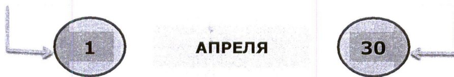
Схема 1. Представление сведений

федеральные государственные служащие, служащие ЦБ РФ, работники ПФР, ФСС РФ, Федерального фонда ОМС, государственных корпораций и др.