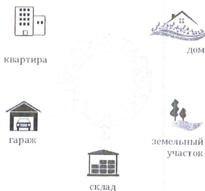
Схема 2. Недвижимое имущество

в) дачный земельный участок - земельный участок, предоставленный гражданину или приобретенный им в целях отдыха (с правом возведения жилого строения без права регистрации проживания в нем или жилого дома с правом регистрации проживания в нем и хозяйственных строений и сооружений, а также с правом выращивания плодовых, ягодных, овощных, бахчевых или иных сельскохозяйственных культур и картофеля).